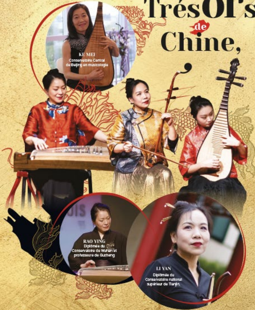
KE MEI Conservatoire Central de Beijing en musicologie