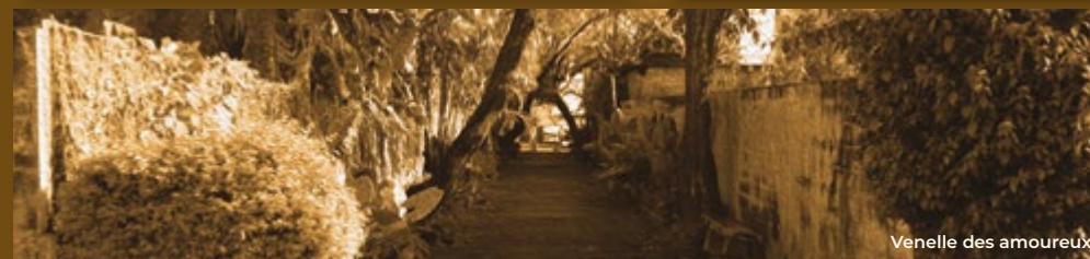
Venelle des amoureux