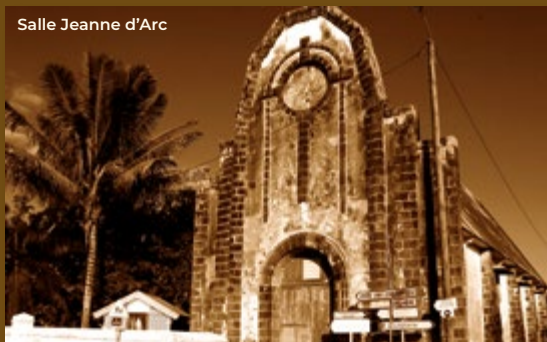
Salle Jeanne d'Arc